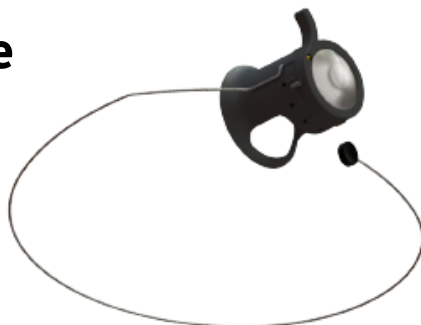
Fenêtre de vision Grossissement 0X