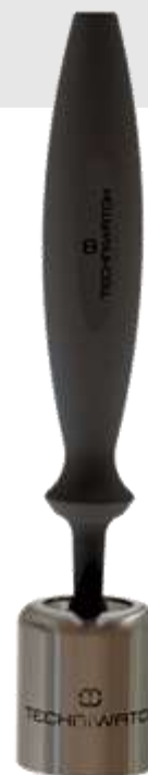
Stylo de nettoyage avec son support